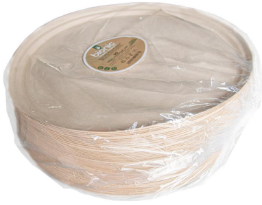
Immagine del pacchetto